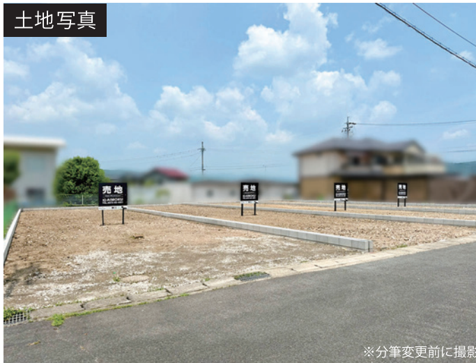
※分筆変更前に撮影