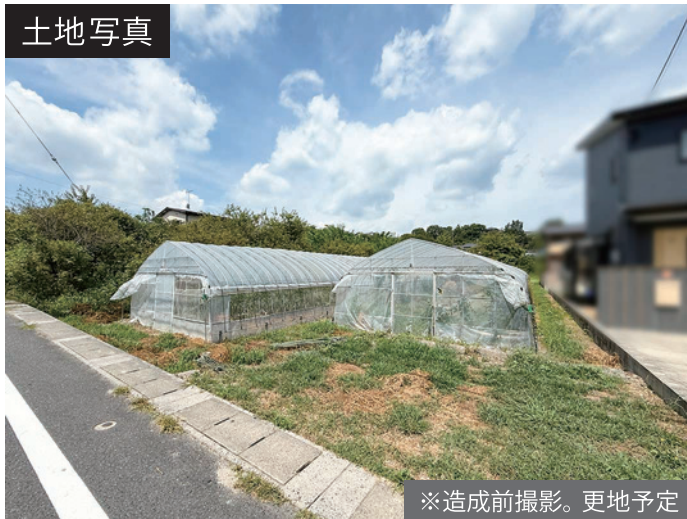
※造成前撮影。更地予定