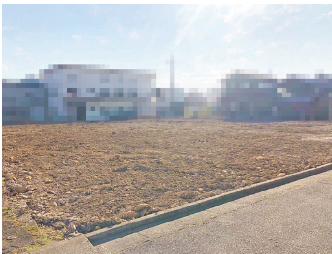
※全5区画造成工事中に撮影

土地写真 泉小学校 徒歩約13分(約1,000m) 泉中学校 徒歩約12分(約950m)